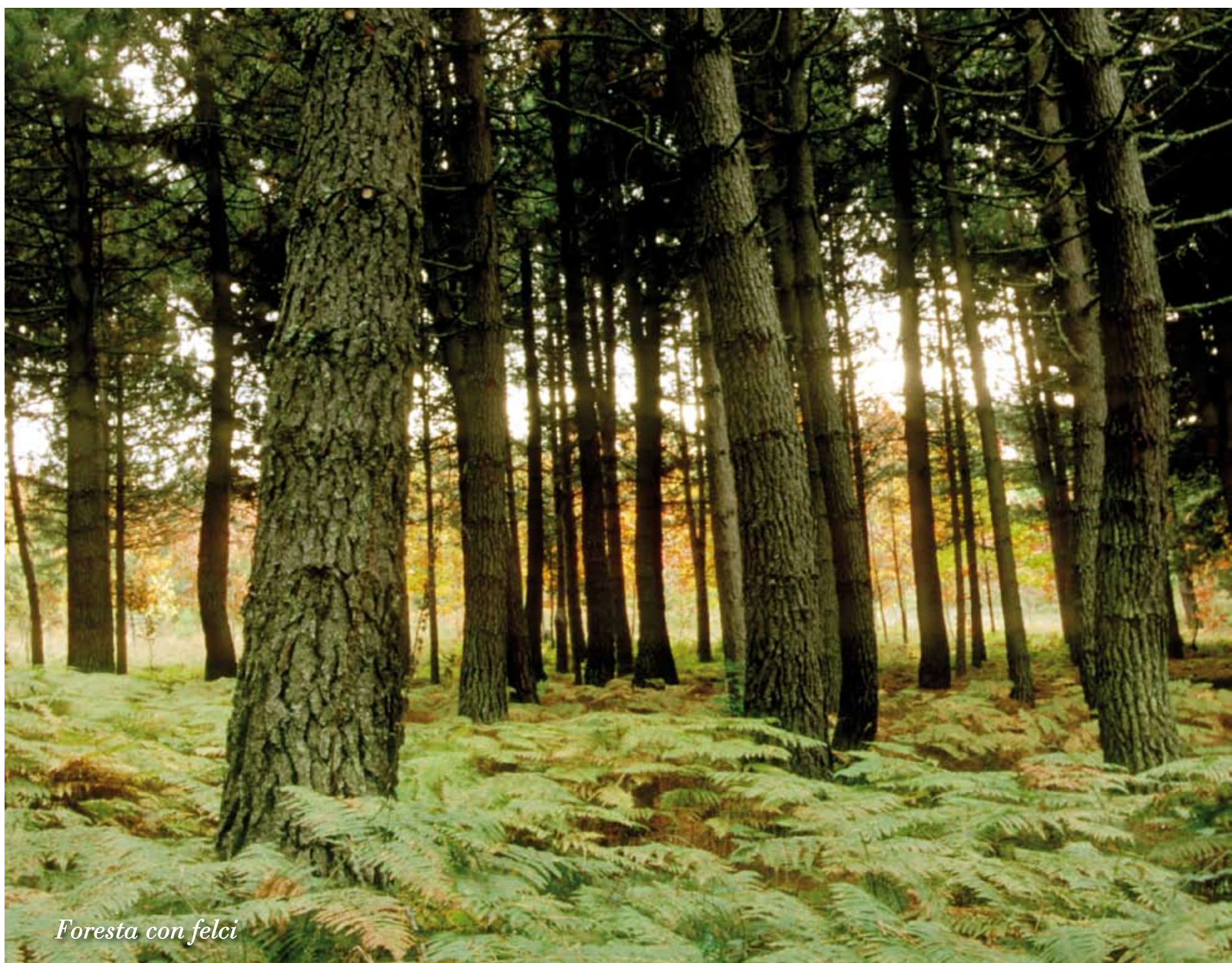
Foresta con felci